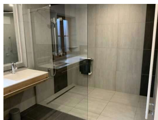
Wohnung Alpspitze – Badezimmer