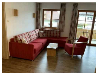
Wohnung Alpspitze – Wohnzimmer (zugleich Küche)