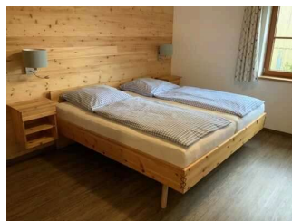
Wohnung Alpspitze – Schlafzimmer