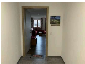
Wohnung Alpspitze – Eingangsbereich