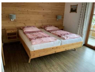
Wohnung Alpspitze – Schlafzimmer