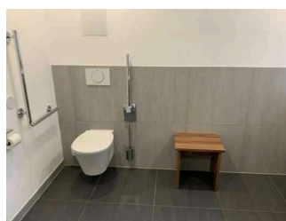
Wohnung Alpspitze – Badezimmer