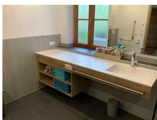
Wohnung Alpspitze – Badezimmer