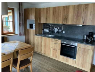
Wohnung Alpspitze – Küche (zugleich Wohnzimmer)