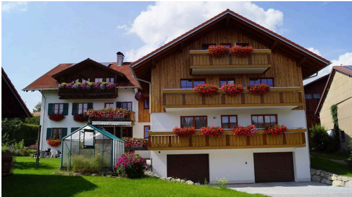
Ferienhof Fischer Ansicht von außen